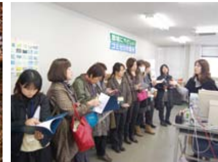
品質管理課の説明