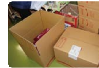
④事業所ごとに箱づめ