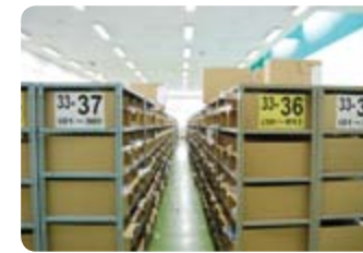
①常時6~7万点の在庫があります