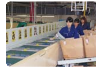
②まずは機械で仕分け