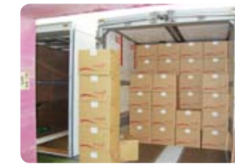
⑤トラックで全国の生協へ