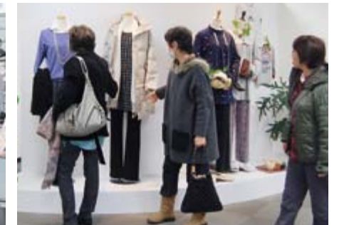
本社エントランス